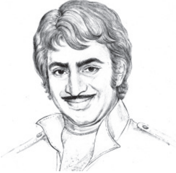
P 'పద్మ భూషణ్' డా॥ కృష్ణ