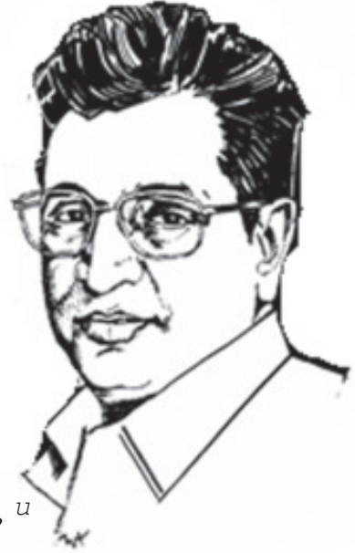
'పద్మభూషణ్' డా॥ కె.వి.వరప్రసాద్‌రెడ్డి U

తన నటన ద్వారా చిత్రసీమలో ఒరవళ్ళు సృష్టించి పద్మభూషణ్‌ని అలంకరించారు ఆయన తన ఔషధాల ద్వారా ఆరోగ్యరంగంలో ఒరవళ్ళు సృష్టించి పద్మభూషణ్‌ని అలంకరించారు ఈయన అందుకే ఆయనని ఈయనకి అంకితం ఇస్తున్నాం.