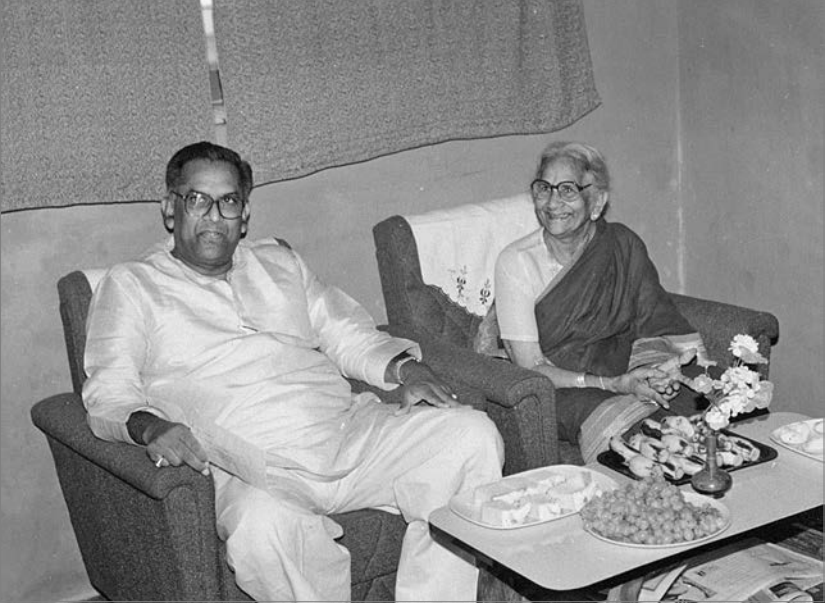
మాతృమూర్తి శ్రీమతి కమలమ్మతో...