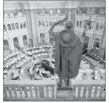
లైబ్రరీ ఆఫ్ కాంగ్రెస్ వాషింగ్టన్ డి.సి.

వీరికి ఏ పీఠం పురస్కారం అందించలేదు - ఇప్పటి ఆచార్యుల పయనం కీర్తిప్రతిష్ఠల కోసం, పురస్కార పీఠాల కోసం - రాజకీయ ప్రాపకం కోసం ప్రాకులాడటం - ఎన్ని దక్కినా ఇంకా ఏమీ కావాలో తెలియని అజ్ఞానంలో కొట్టుమిట్టాడటం చూస్తుంటే అర్థత లేనివారే - ఇలా అద్రులుజాస్తుంటారనుకోవాలి - మరిన్ని వివరాలు ‘కీర్తిప్రతిష్ఠలు’లో చదవండి.