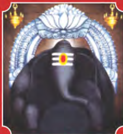
కాణిపాకం వరసిద్ధి వినాయకుడు