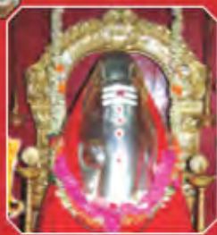
కాజీపేట శ్వేతార్కమూల గణపతి