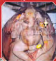
రాయదుర్గం దశభుజ గణపతి