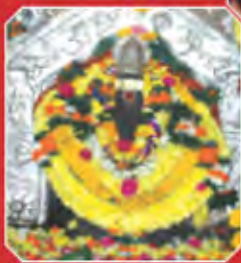
అయినవిల్లి సిద్ధి వినాయకుడు