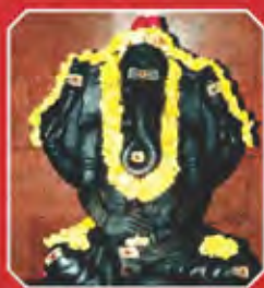
శ్రీశైల సాక్షి గణపతి