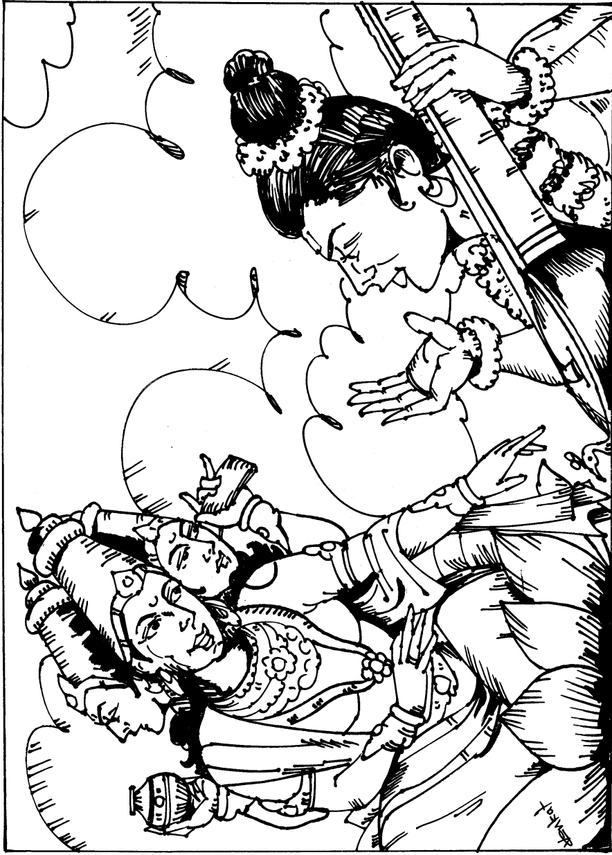
నారదునికి లోక కళ్యాణము కొరకు చేయవలసిన కార్యము వివరిస్తున్న బ్రహ్మ

ఒకనాడు నారదుడు తన జనకుడగు బ్రహ్మదేవుని సందర్శించుటకై సత్యలోకమునకు ప్రయాణమై వెడలినాడు.