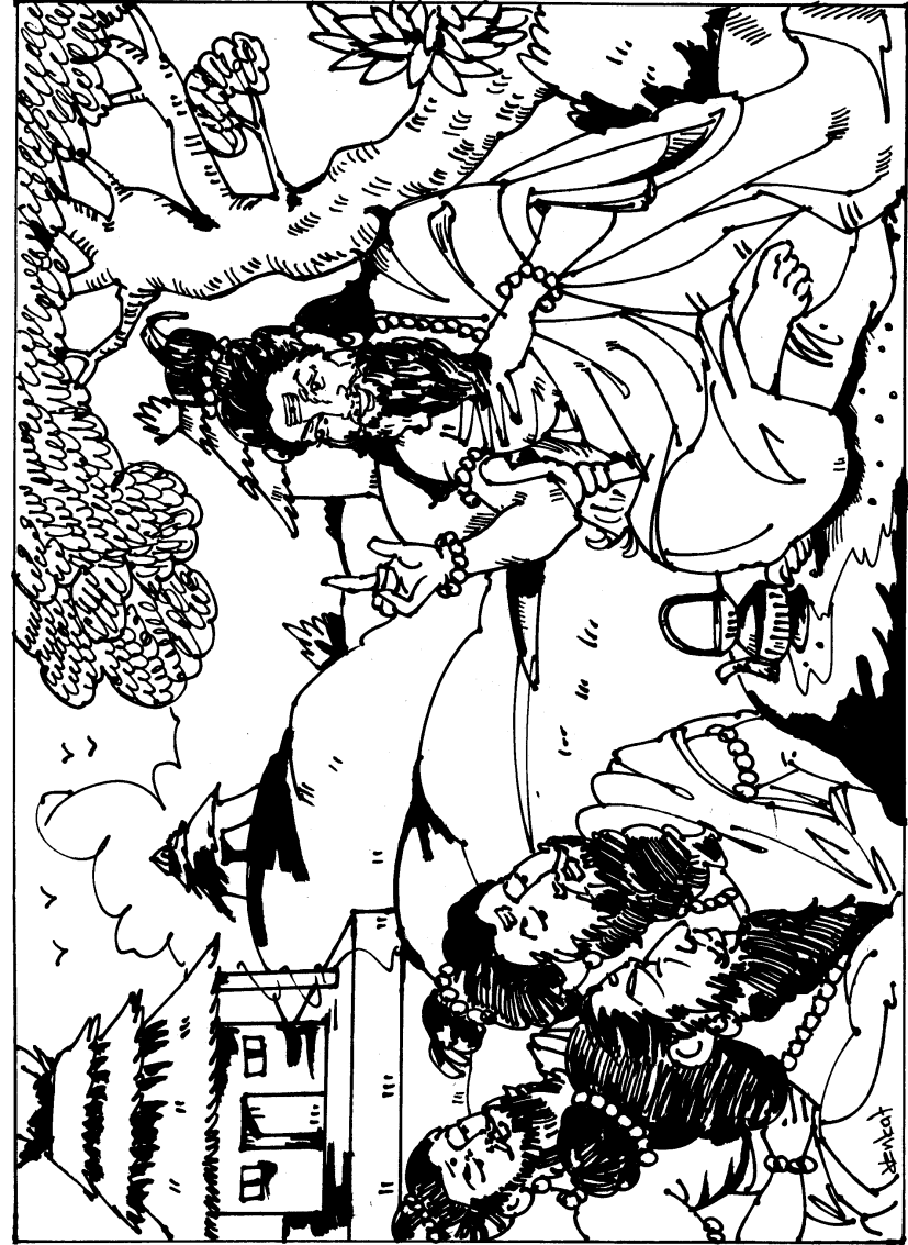
3. సూత మహాముని ముందుగా సృష్టిక్రమము మరియు శ్రీ వేంకటేశ్వరస్వామివారి దివ్యచరితము వివరించుట

అని పలికి సూతులవారు, ముందుగా ఈ సృష్టిక్రమము గూర్చి యిట్లు చెప్పుటకు ఆరంభించెను.