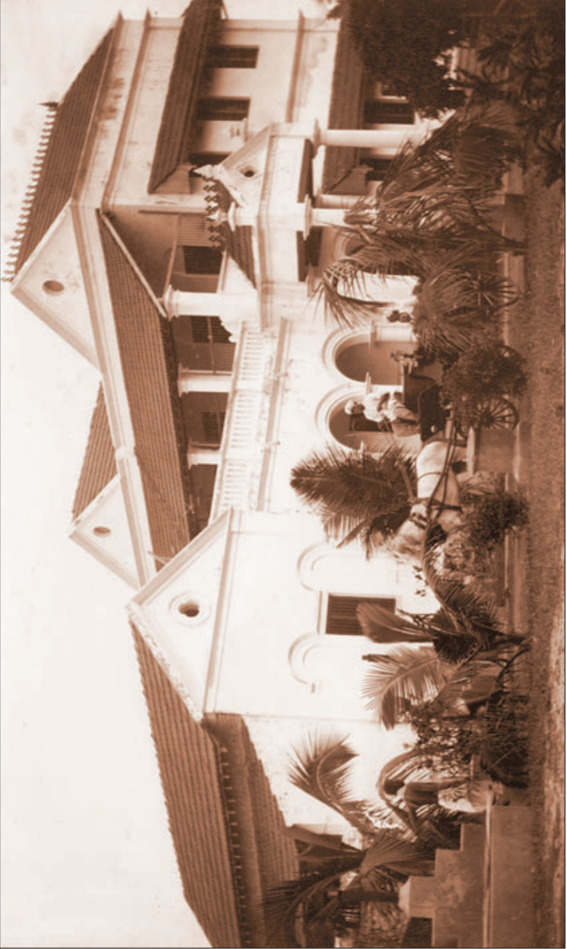
సుపిశాలమైన విద్యాలయ ప్రాంగణం - బందరు