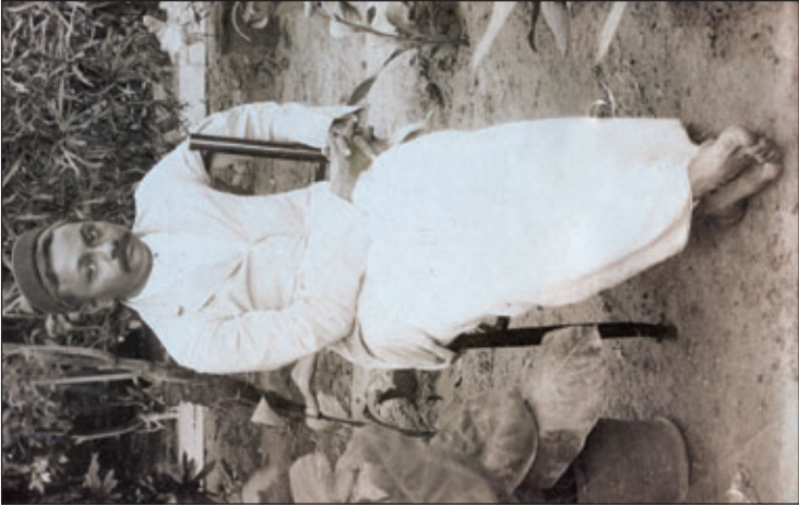
శ్రీ పురాణం సూరిశాస్త్రి