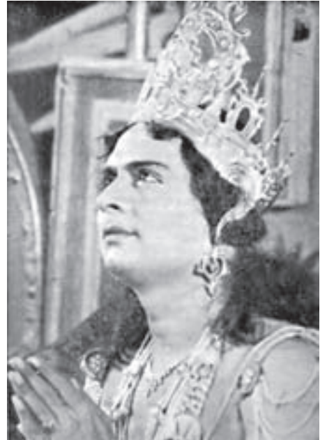
‘శ్రీ వేంకటేశ్వర మహాత్మ్యం’ (1939)లో సి.ఎస్.ఆర్.

“భగవాన్ బాలాజీ”లో ఎస్.వరలక్ష్మి, శాంతకుమారి తమ నాలుగు పాటలూ తామే పాడుకొన్నారు. ‘శ్రీ దేవ్ తేరీ హుం అర్థాంగినీ’, ‘గోపాల నందగోపాలా’ భలే భేషుగ్గానూ, బాగానూ పాడగా, యివి రెండూ ఒక రికార్డుగా (జిఇ33536) విడుదలైనవి. తక్కిన పాటలు గీతా దత్, మన్నా దే, లత, ఆశా, రఫి, మహేంద్ర