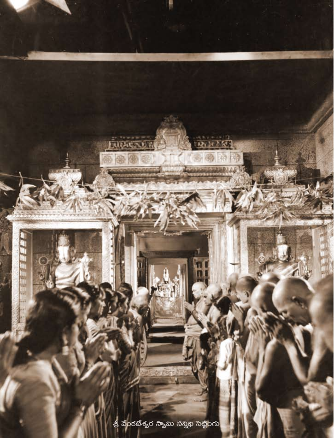
శ్రీ వేంకటేశ్వర స్వామి సన్నిధి సెట్టింగు