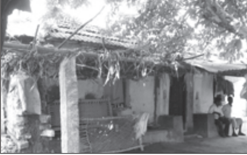
ఐలమ్మ జన్మించిన ఇల్లు (కీష్టపురం)