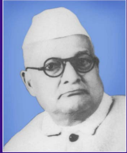
ఆంధ్ర పితామహుడు శ్రీ మాడపాటి హనుమంతరావు