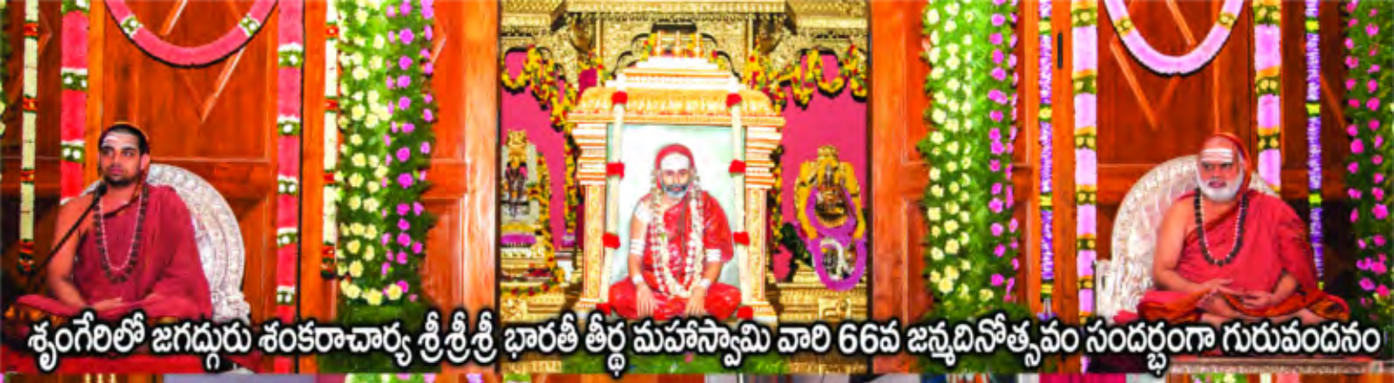
శృంగేరిలో జగద్గురు శంకరాచార్య శ్రీశ్రీశ్రీ భారతీ తీర్థ మహాస్వామి వారి 66వ జన్మదినోత్సవం సందర్భంగా గురువందనం