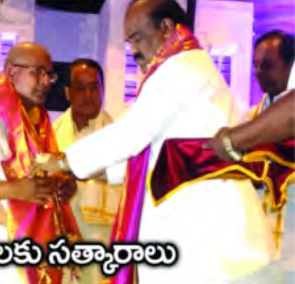
ఉభయ తెలుగు రాష్ట్రాల్లో ఉగాది సందర్భంగా పండితులకు సత్కారాలు