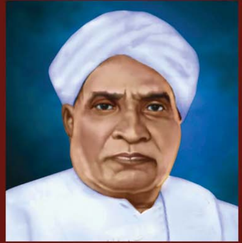
ఆగస్టు 29 : గిడుగు జయంతి తెలుగుభాషా దినోత్సవం