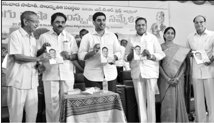
'బుద్ధయానం' వ్యాసాల సంకలనాన్ని ఆవిష్కరిస్తున్న పెద్దలు