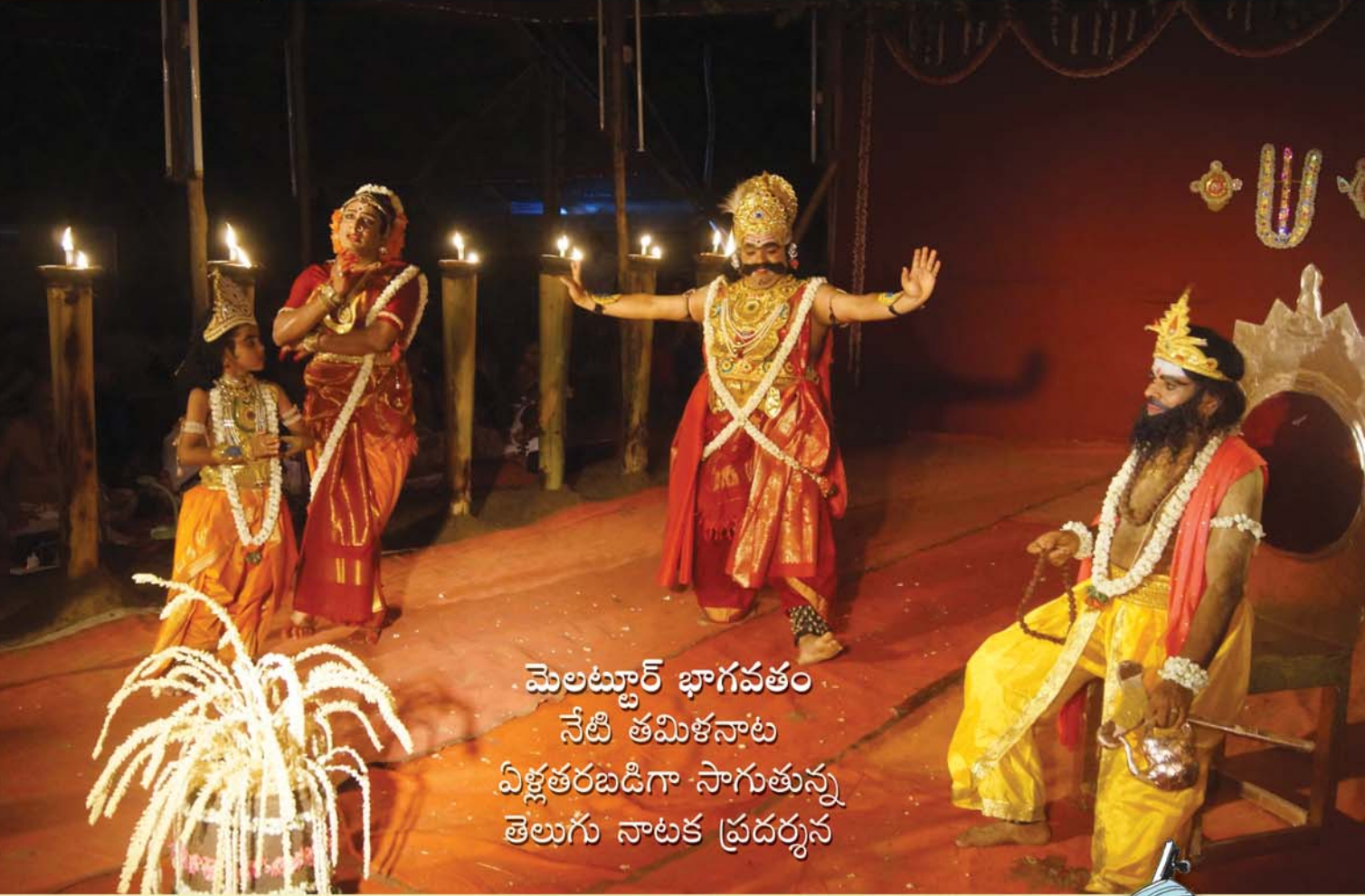
మెలట్టూర్ భాగవతం నేటి తమిళనాట విశ్లేతరబడిగా సాగుతున్న తెలుగు నాటక ప్రదర్శన