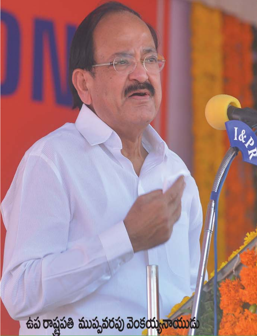
ఉప రాష్ట్రపతి ముప్పవరపు వెంకయ్యనాయుడు