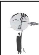
ఇత్తతి ఘోషించె మునాదియెల్లరకు బ్రాతాపానగూఢార్థముల్...