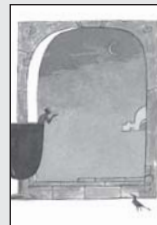
బూపంబును జేతికిచ్చి తినవద్దని చెప్పుట యేల దైవమా?