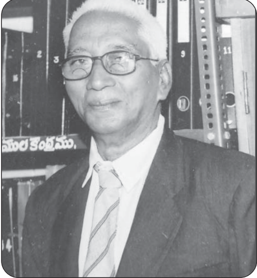
కనువెలుగు : 11-11-1933 కనుమరుగు : 6-10-2019

“ఇందులో ఇది శాలంకాయనుల అపురూపనాణెం. ఇది సిరిముకుని అంటే శ్రీముఖుని నాణెం. ఇది శాతవాహనుల నాణేలు. ఇవి చాలుక్యలవి, ఇవి కాకతీయులవి, ఇవి విష్ణు కుండినులవి, ఇలా చూడండి ఇది తెలుగక్షరాలున్న నాణెం. ఇది రాజరాజనరేంద్రుడు వేసిన బంగారు నాణెం. ఇవి ముస్లిమ్ పరిపాలకులు వేసినవి. ఇవి స్వాతంత్ర్యం వచ్చాక వేసుకున్న నాణేలు, ఇవి కమ్మో మెరేటివ్ కాయిన్స్ - అంటే స్మార్క నాణేలు, అదిగో అవి బ్రిటిషు వారు వేసిన నాణేలు...”, అంటూ మధ్యలో మనం వేసే ప్రశ్నల్ని పట్టించుకోకుండా...కాశీపట్నం చూడరబాబూ అన్న చందాన నాణేల చరితం చూడరబాబూ అన్నట్లు ఏకబిగిన తన నాణేల చారిత్రక పురావాలను విప్పి చెప్పేవారు. అప్పు చెప్పేవారు.