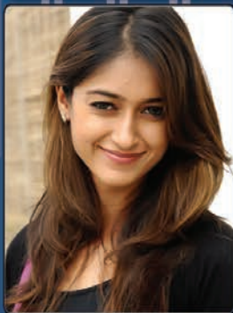
ముఖ చిత్రం - జలియానా