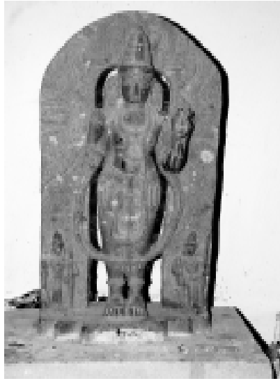
తవ్వకాల్లో బయల్పడ్డ విష్ణుమూర్తి, సూర్యవిగ్రహాలు