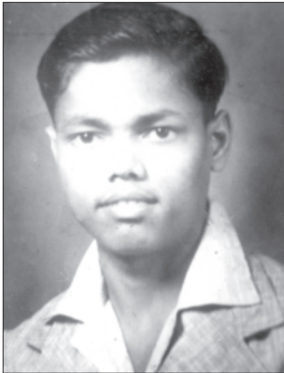
1942-ఎస్.ఎస్.ఎల్.సి. పరీక్షకి ఇచ్చిన ఫోటో

రాసిన వెంటనే రచనను పోస్టు చేయకుండా, కొన్ని రోజులు ఆగి తిరిగి చదివేవారు. బాగులేదనిపిస్తే చించేసే వారు. ఫరవాలేదనిపిస్తే పత్రికకి పంపేవారు. పంపిన వాటిలో ఒక్క కథ తప్ప ఏదీ తిరిగి రాలేదు. 1963లో 'భారతి' వారు తిప్పి పంపిన 'పథ' కథను ఆయన తిరిగి ఏ పత్రికకీ పంపలేదు. విశాఖ రచయితల సంఘం ప్రచురించిన 'విశాఖ' పత్రికలో వారి బలవంతం మీద ఆ కథ వచ్చింది. పంపిన రచనలన్నీ ప్రచురించబడ్డాయి. 'కాళీపట్నపు' అనే తమ యింటి