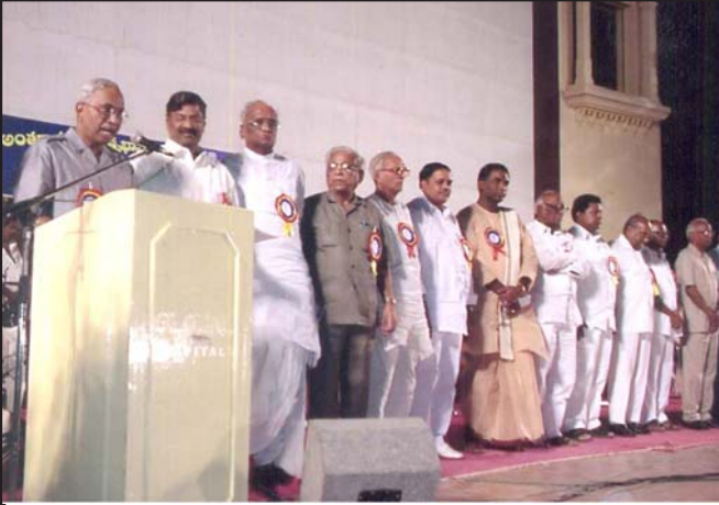
2003-తెలుగు భాషోద్యమసమాఖ్య ఆవిర్భావసభలో మూడవ వ్యక్తి