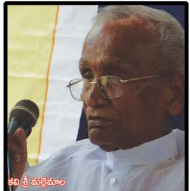
కవి శ్రీ మల్లెమాల

తెలుగే ఊపిరిగా తెలుగు పద్యంపై పట్టుతో కీర్తిగాంచిన కవి... తెలుగు భాషోద్యమానికి అండగా నిలిచిన 'మల్లెమాల'