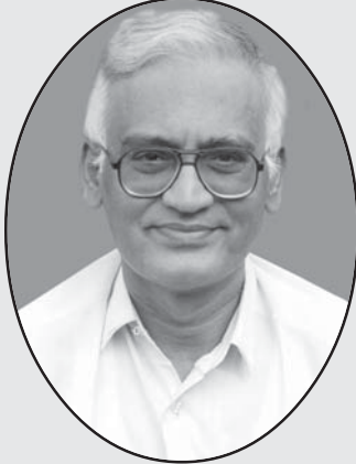
ఎన్.పి.వై.రెడ్డి, బి.ఇ., భారత పార్లమెంటు సభ్యులు నంది సంస్థల అధినేత, నంద్యాల. నడుస్తున్న చరిత్ర పోషకులు

సమాజంలోని ముఖ్యమైన రంగాలన్నిటికీ పరస్పర సంబంధం ఎంతో కొంత ఉంటుంది. వ్యక్తిసంస్కృతి సమాజసంస్కృతి కూడా పరస్పరం సంబంధితమై ఉంటాయి. అయితే మాత్రం మొత్తంగా సమాజాన్ని ప్రభావితం చేసేది, పాలకుల విధానాలే. నేటి ప్రజాస్వామిక వ్యవస్థలో ప్రభుత్వాల, పాలకవర్గాల విధానాలు మొత్తం సమాజాన్ని వ్యవస్థల్ని ప్రభావితం చేస్తాయి. మద్యపానం, పాగతాగడం, గుట్కా, సినిమాలు, టీవీ వంటి తీవ్ర ప్రభావం చూపే రంగాల పట్ల మన ప్రభుత్వ విధానాలు సమాజాన్ని సర్వనాశనం చేసేవిగా ఉన్నాయి. వాటిపై వచ్చే ఆదాయాన్ని పెంచుకోవడమే లక్ష్యంగా పెట్టుకొని, వాటిని నియంత్రించడం తమ పని కాదన్నట్లు వదిలివేసే ధోరణితో ప్రభుత్వాలు వ్యవహరిస్తున్నాయి. దీన్ని ఎంతమాత్రం సహించకూడదు. రాజకీయపార్టీలు తమకు ప్రజల పట్ల ఉన్న బాధ్యతను గుర్తించి, ఇకనైనా ప్రభుత్వాలను ఇలాంటి ముఖ్య అంశాలపై కట్టి చెయ్యాలి. వ్యక్తులను, కుటుంబాలను నాశనం చేస్తూ, హింసను, విధ్వంసాన్ని విచ్చలవిడిగా ప్రోత్సహిస్తున్న ఈ రంగాలను కట్టి చెయ్యలేని ప్రభుత్వాలు - అవి ఏ పార్టీ నడిపేవైనా సరే - ప్రజలకు మేలు చేకూర్చలేవు. ఎన్ని అభివృద్ధి కార్యక్రమాలను చేపట్టినా అవి సమాజ వ్యతిరేక ప్రభుత్వాలగానే మిగిలిపోతాయి.