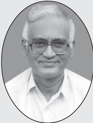
ఎన్.వి.వై.రెడ్డి, బి.ఇ., భారత పార్లమెంటు సభ్యులు నంది సంస్థల అధినేత, నంద్యాల. నడుస్తున్న చరిత్ర పోషకులు

ఈ నాలుగు మాటలు వ్రాయబోయే సమయానికి - 12వ తేదీ సా.4గం.లకు పెను తుపాను ఉత్తరాంధ్రనూ, ఒడిశానూ అల్లకల్లోలం చేయడానికి ముంచు కొచ్చేస్తుంది. ఫైలిన్ అనే ఈ తుపాను తీవ్రత గంటకు 230 కి.మీ. వేగంతో వస్తోంది. ఇన్ని అడుగుల ఎత్తున ఉప్పెన ముంచబోతున్నదో భయాన్ని కలిగిస్తోంది. లక్షలాది మందిని రక్షించటానికి ఒడిశా, ఆంధ్రప్రదేశ్ ప్రభుత్వాలు పునరావాస శిబిరాలను ఏర్పాటు చేస్తున్నవి. ప్రాణ నష్టాన్ని తగ్గించటమే లక్ష్యంగా అధికార యంత్రాంగం తీవ్రంగా యత్నిస్తున్నది. ఈ తరుణంలోనూ, నష్టాల తీవ్రత తేలిస తరువాతా మన తోటి ప్రజల్ని ఆదుకోవడానికి ప్రభుత్వంతోపాటు ప్రజలు కూడా శక్తివంచన లేకుండా తోడ్పడవలసి వుంది. దసరా పండుగరోజుల్లో ఈ పెనుముప్పు రావటాన్ని తలచుకొంటేనే మనసు వికలం అవుతున్నది. అందరూ సంతోషంగా ఉంటేనే కదా, ఏ పండుగైనా. ఎంత తక్కువ నష్టంతో ఈ ముప్పు నుంచి బయటపడగలమో కొద్ది రోజులు గడిస్తేనేగాని తెలీదు. తుపాను ముప్పుకు లోనైన ప్రజలందరికీ మనమంతా అండగా నిలవాలి.