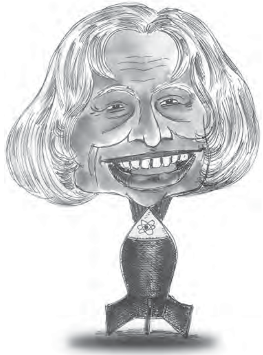
అబ్దుల్ మిసైల్ కలాం