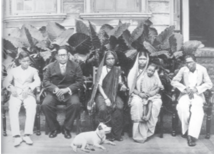
కుటుంబ సభ్యులతో అంబేద్కర్, రమాబాయి, రాజగృహ, ముంబయిలో