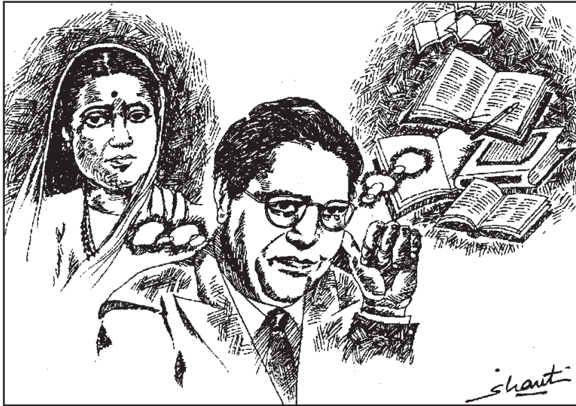
భార్య ప్రేమ, పుస్తకాల ప్రేమ రెండింటిలో దేనికి ప్రాధాన్యత నివ్వాలి - బాబాసాహెబ్ కి ఈ ప్రశ్న నిరంతరం ఎదురయ్యేది.

చదువు గురించి రమాబాయి, బాబాసాహెబ్ ల మధ్య వాదన జరుగుతూ ఉండేది. కానీ బాబాసాహెబ్ చదువుకోవడానికి ఎప్పుడు కూర్చుంటాడో అప్పుడు ఆయన అధ్యయనానికి మాత్రం ఆమె ఎలాంటి ఆటంకం కలిగించేది కాదు. ఆ విషయంలో మాత్రం ఆమె అప్రమత్తంగా ఉండేది. అల్లరిచేసే పిల్లలని బైటకి పంపించేది. లేదంటే అల్లరి చెయ్యవద్దని