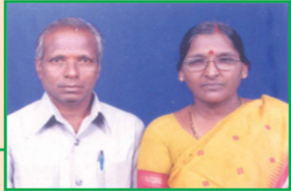
భగవద్గీతా ప్రచారకులు రచయిత కుటుంబ మిత్రులు తిరుమాని శ్రీకృష్ణభగవాన్, నాగమణి దంపతులు